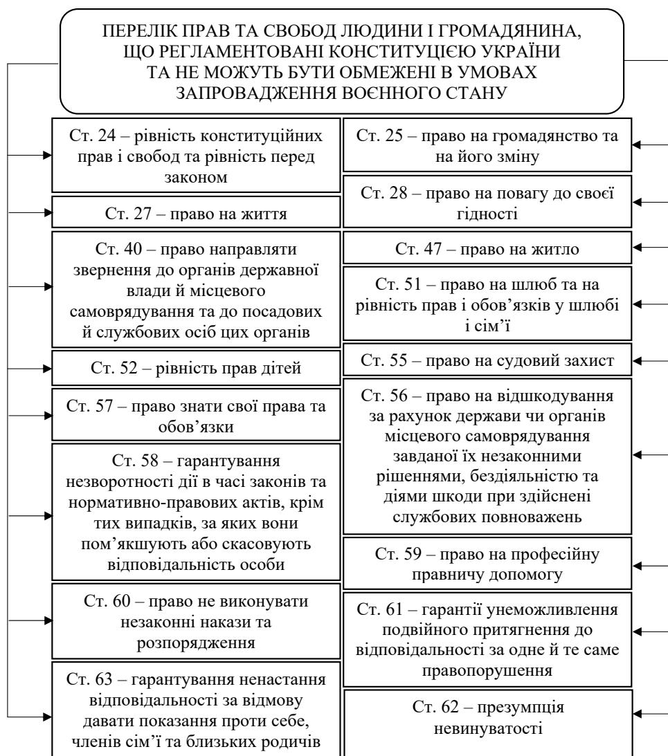
Рис. 1. Перелік прав та свобод людини і громадянина, що регламентовані Конституцією України та не можуть бути обмежені в умовах запровадження воєнного стану